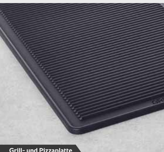
Grill- und Pizzaplatte

Für weitere Informationen fordern Sie bitte unseren Zubehörprospekt oder unsere Anwendungsprospekte an. Oder Sie besuchen uns im Internet unter www.rational-online.com .