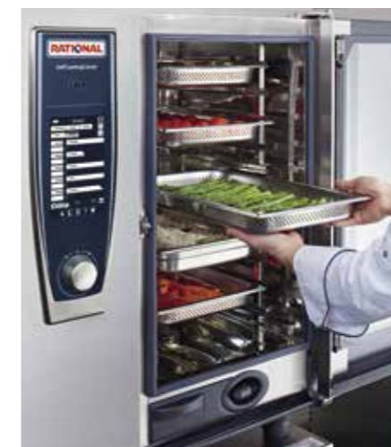
Mise en place