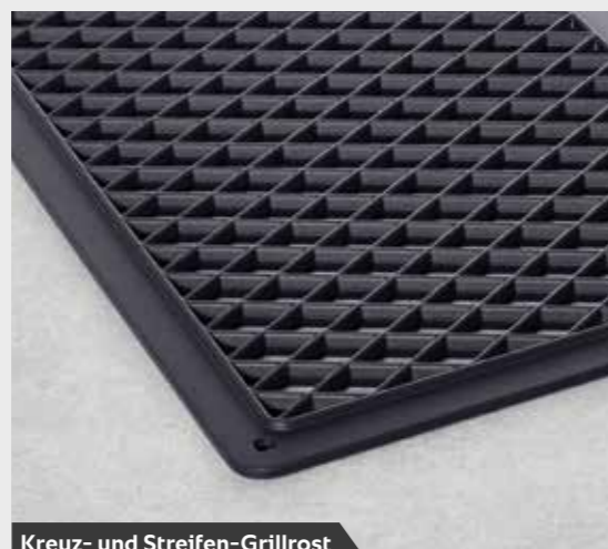
Kreuz- und Streifen-Grillrost