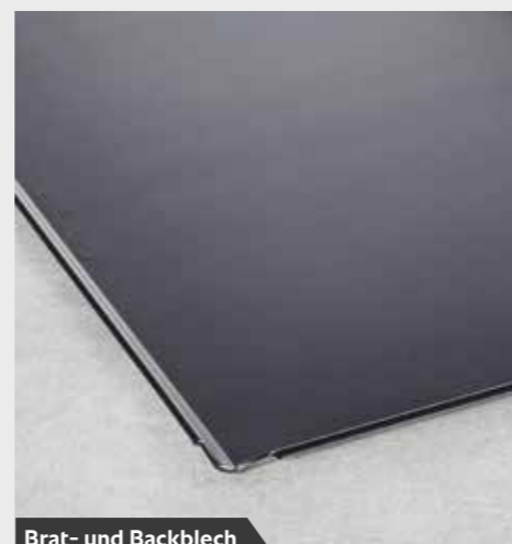
Brat- und Backblech